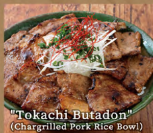
"Tokachi Butadon" (Chargrilled Pork Rice Bowl)