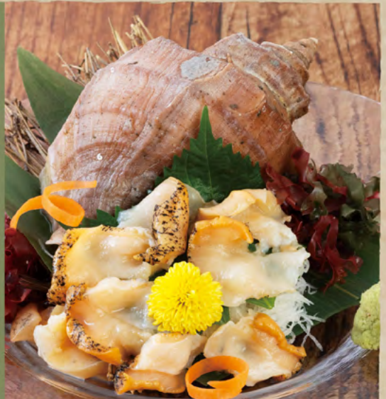
※写真はイメージです。 ※The photographs are for illustrative purposes only

本日の鮮魚おすすめ Recommended Fresh Fish of the Day Please ask our staff for details.