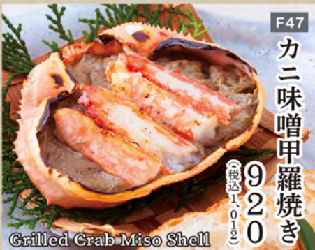
Grilled Crab Miso Shell