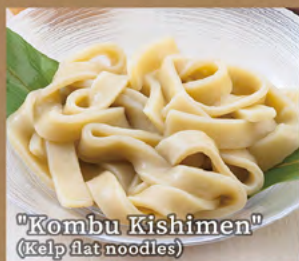
"Kombu Kishimen" (Kelp flat noodles)