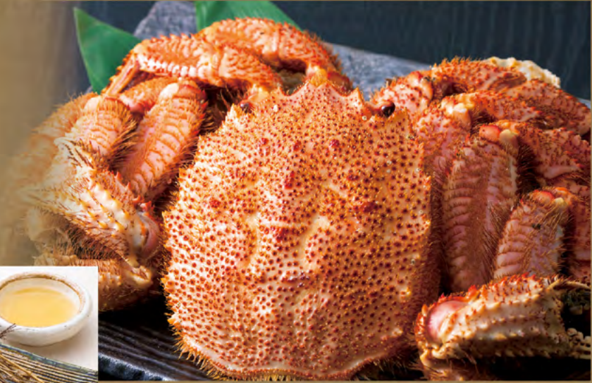
Hamayude-Style Boiled Horsehair Crab ※Please ask our staff for details.