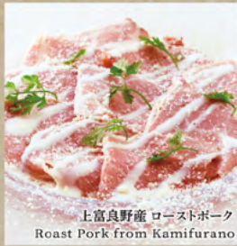
上富良野産 ローストポーク Roast Pork from Kamifurano