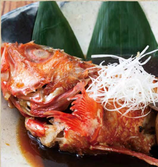
※写真はイメージです。 ※The photographs are for illustrative purposes only

その時期にしか味わえない旬の魚介を厳選して ご用意。別紙おすすめメニューをご覧ください。