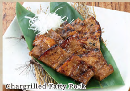
Chargrilled Fatty Pork