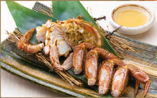
Hamayude-Style Boiled Horsehair Crab Harf ※Please ask our staff for details.