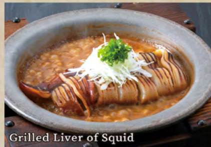
Grilled Liver of Squid