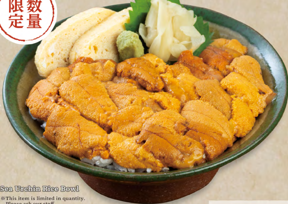
Sea Urchin Rice Bowl

※This item is limited in quantity. Please ask our staff about the availability for the day.