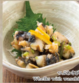
つぶわさび Whelks with wasabi