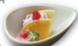
イチゴのパンケーキ

イチゴのパンケーキ 黒みつわらび餅 カップティラミス チョコシューアイス イチゴのプチシュー