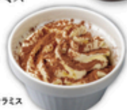
カップティラミス