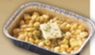
コーンバター ホイル焼き