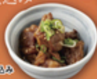
手作り牛すじ煮込み