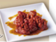
やみつきコリコリ牛タン