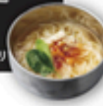
アジアン冷麺スイートチリ