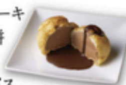
チョコシューアイス