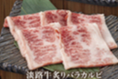
淡路牛炙りバラカルビ