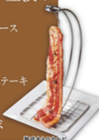
熟成大トロカルビ