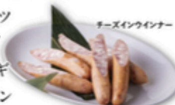
チーズインウインナー