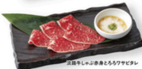
淡路牛しゃぶ赤身とろろワサビタレ