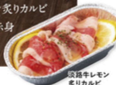
淡路牛レモン 炙りカルビ