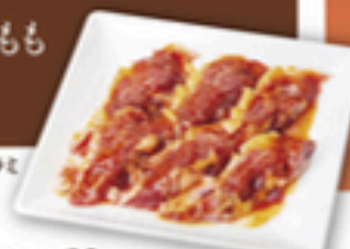
やみつきポークハラミ