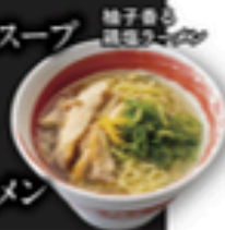
柚子香る鶏塩ラーメン

ふわふわ玉子と野菜のスープ わかめスープ ピリ辛カルビスープ 柚子香る鶏塩ラーメン