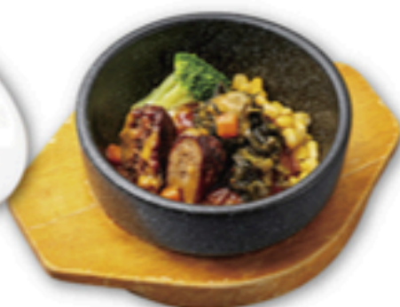
石焼肉超VSハンバーグピビンバ