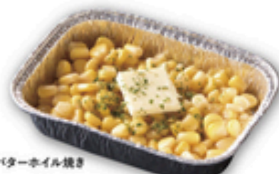
コーンバターホイル焼き