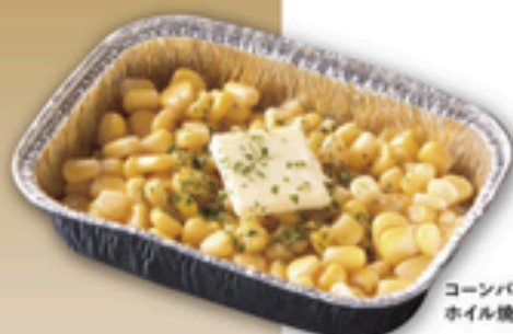
コーンバター ホイル焼き