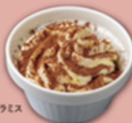
カップティラミス