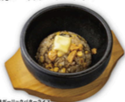
石焼ガーリックバターライス