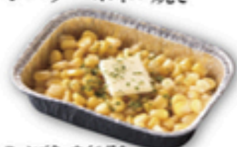
コーンバターホイル焼き