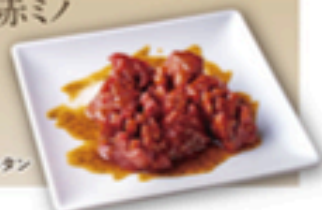
やみつきコリコリ牛タン

やみつきコリコリ牛タン やみつきカルビ やみつき炙りカルビ やみつきポークハラミ やみつき鶏もも やみつき赤ミノ