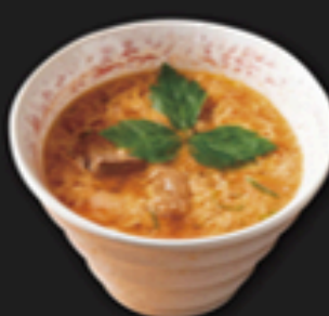
ピリ辛カルビスープ