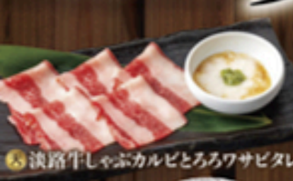
⑤ 淡路牛しゃぶカルビとろろワサビタレ