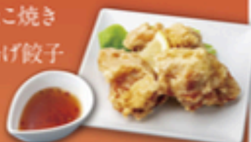
秘伝の鶏唐揚げ ◆ スイートチリソース

フライドポテト (ケチャップ) フライドポテト (ガーリックトリュフ) 秘伝の鶏唐揚げ ◆ スイートチリソース 揚げたこ焼き 香月揚げ餃子