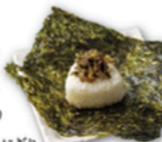
韓国高菜おにぎり

ごはん (小) ごはん (中) 韓国おにぎり 韓国高菜おにぎり 大人のわさび茶漬け ふわふわ玉子と野菜のクッパ とろ〜りチーズの石焼オムライス 石焼ガーリックバターライス