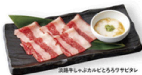
淡路牛しゃぶカルビとろろワサビタレ