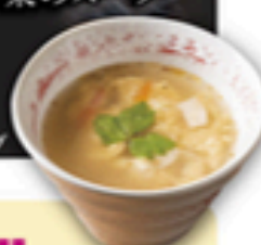
ふわふわ玉子と野菜のスープ