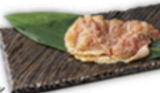
スパイシーチキン