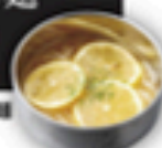
すっきりはちみつレモン冷麺