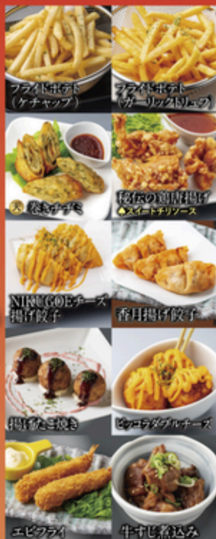
フライドポテト (ケチャップ)