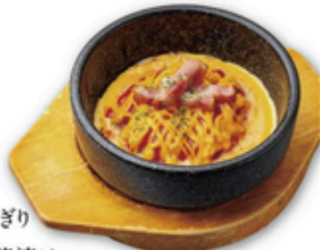
とろ〜りチーズの 石焼オムライス