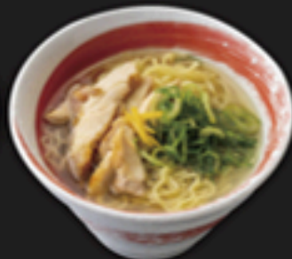
柚子香る鶏塩ラーメン