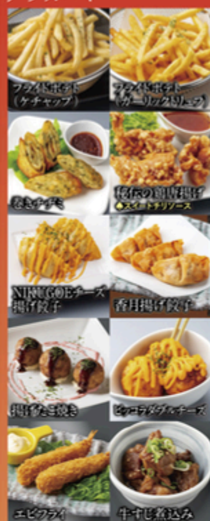
フタホロボット (ケチャップ)