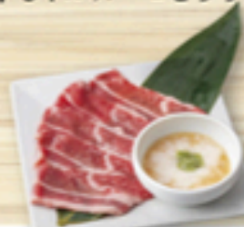
牛しゃぶカルビとろろワサビタレ