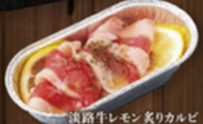
淡路牛レモン炙りカルビ