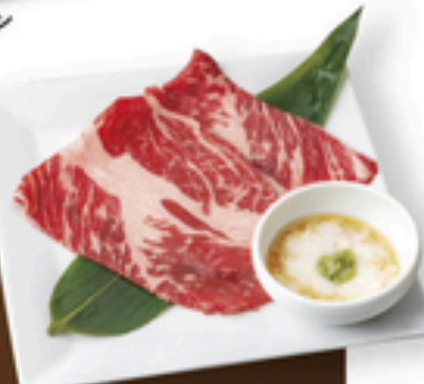
牛しゃぶロースとろろわさびタレ