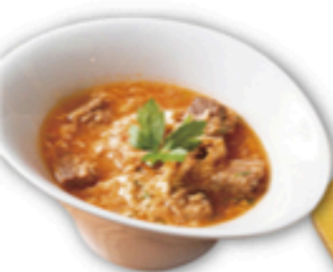
ピリ辛カルビクッパ