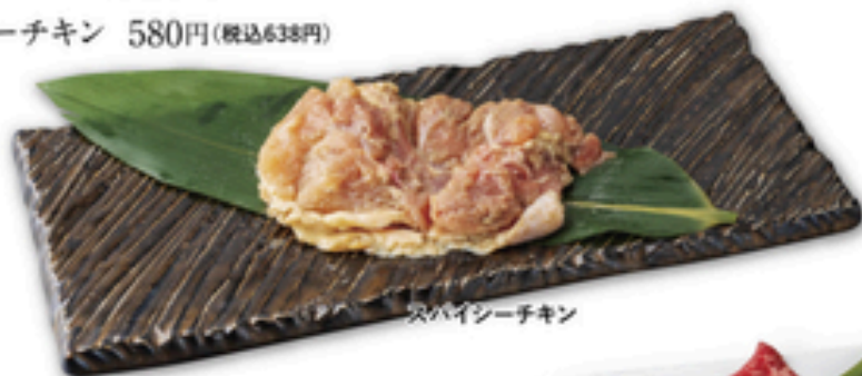
スパイシーチキン