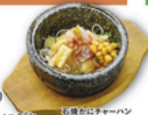
石焼かにチャーハン