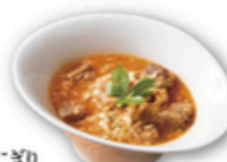
ピリ辛カルビクッパ

ごはん (小) ごはん (中) 韓国おにぎり 韓国高菜おにぎり 大人のわさび茶漬け ビビンバ ふわふわ玉子と野菜のクッパ ピリ辛カルビクッパ とろ〜りチーズの石焼オムライス 石焼ビビンバ 石焼ガーリックライス 石焼かにチャーハン