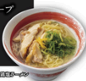
柚子香る鶏塩ラーメン