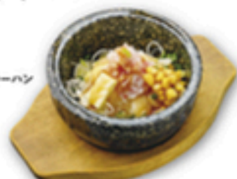
石焼かにチャーハン