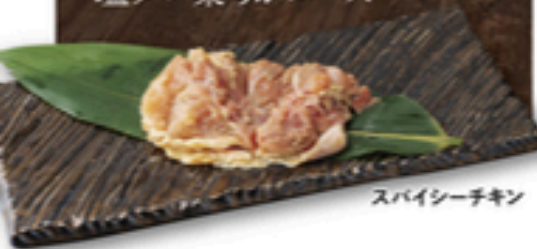
スパイシーチキン