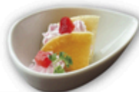
イチゴのパンケーキ