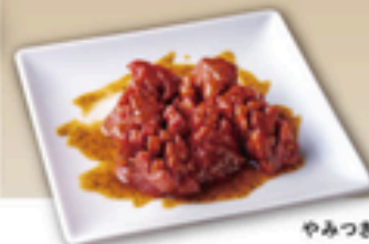
やみつきコリコリ牛タン