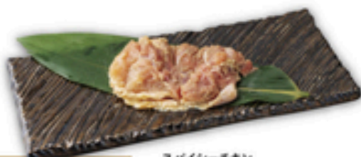
スパイシーチキン