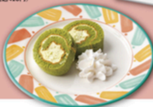
季節のロールケーキ