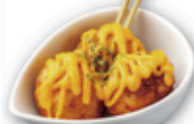
ピッコラダブルチーズ