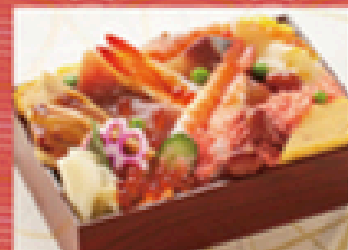
海鮮清けちらし 1,800円 (税込1,980円)