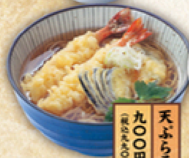
天ぷらそば 九〇〇円 (税込990円)