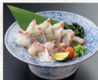
鯛の薄造り 800円(税込880円)