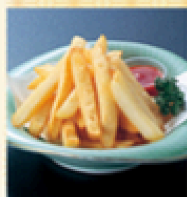
フライドポテト 350円 (税込385円)