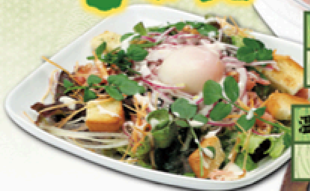
温泉玉子のシーザーサラダ