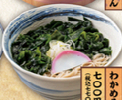
わかめそば 七〇〇円 (税込770円)