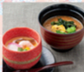
茶碗蒸し・汁セット 430円(税込473円)