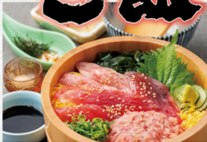
まぐろ三味おひつご飯 1,400円(税込1,540円)