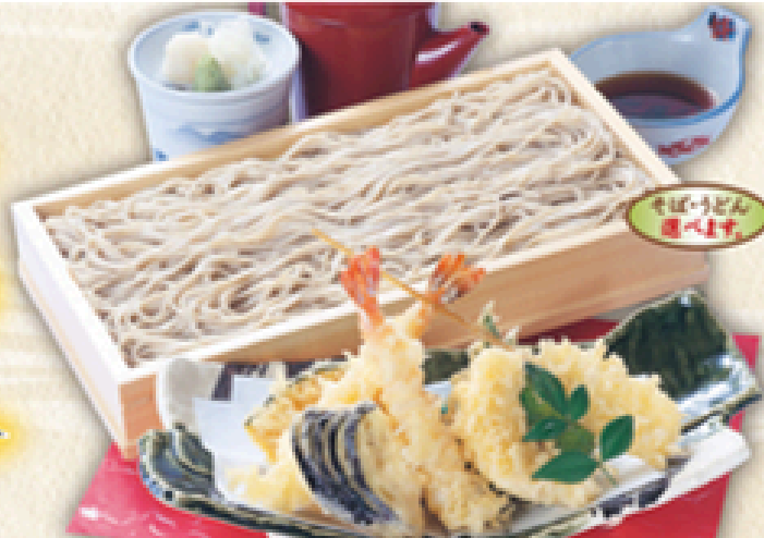
天盛りせいろそば 1,280円(税込1,408円)