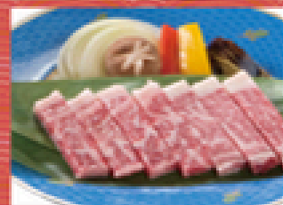
淡路牛ステーキ 2,380円 (税込2,618円)