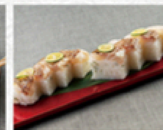
鯛の押しずし 1,780円(税込1,958円)