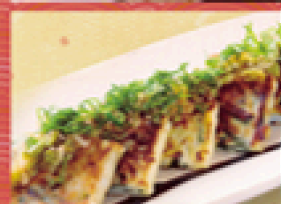
海鮮チヂミ 700円 (税込770円)