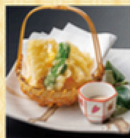
山芋てんぷら 400円 (税込440円)