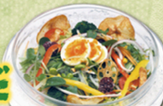
20品目の健康サラダ