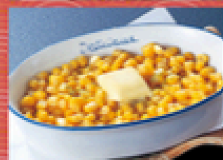
コーンバター 350円 (税込385円)