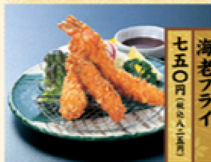
海老フライ 750円 (税込825円)