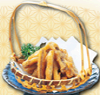
ごぼう唐揚げ 400円 (税込440円)