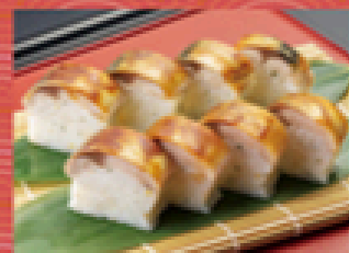
サバ棒寿司 1,780円 (税込1,958円)