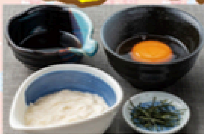
山かけとろろセット 350円(税込385円)