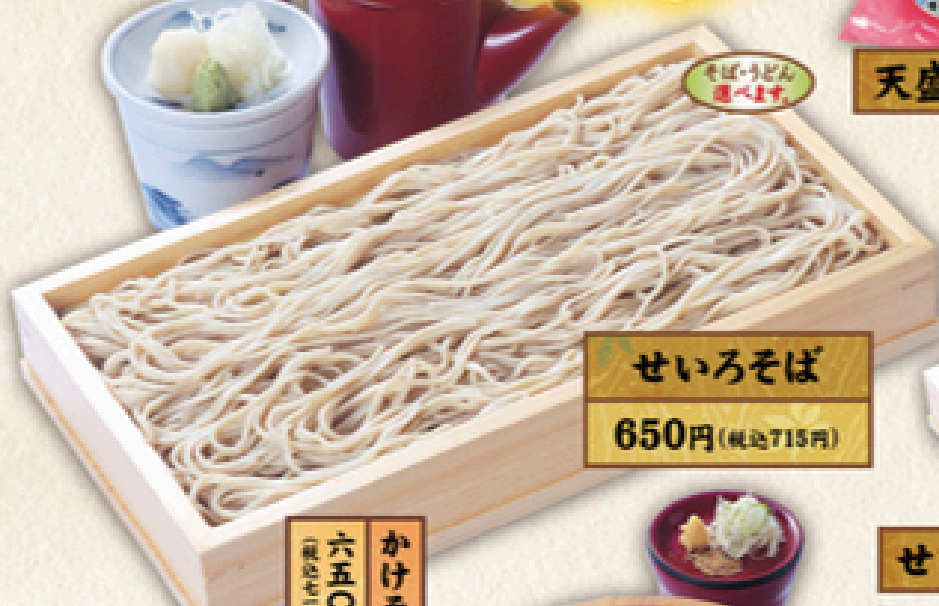
せいろそば 650円(税込715円)