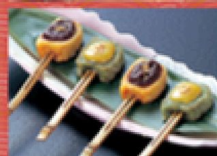
生焼田楽 550円 (税込595円)