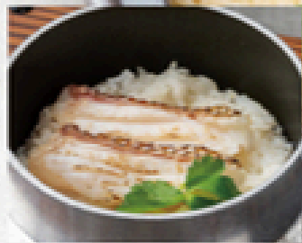
鯛釜めし 800円(税込880円)