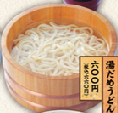
湯だめうどん 六〇〇円 (税込660円)