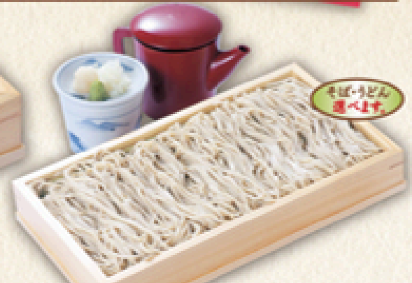
せいろそば1.5盛り 800円(税込880円)