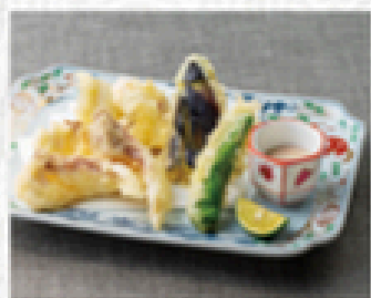
鯛の天ぷら 800円(税込880円)