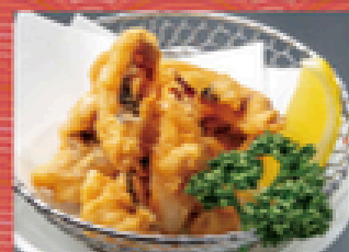
イカの唐揚げ 400円 (税込440円)