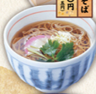
かけそば 六五〇円 (税込705円)