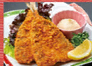
アシフライ 680円 (税込738円)