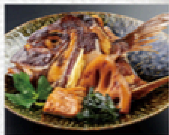
鯛あら炊き 880円(税込950円)