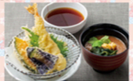
天ぷら・汁セット 500円(税込550円)