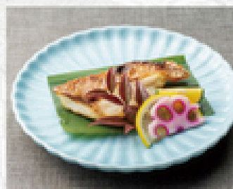
鯛の塩焼き 800円(税込880円)