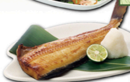
ほっけ焼き 700円 (税込770円)