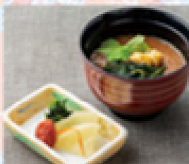
汁・香の物セット 200円(税込220円)