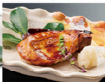
はまち照り焼き 1,000円 (税込1,100円)