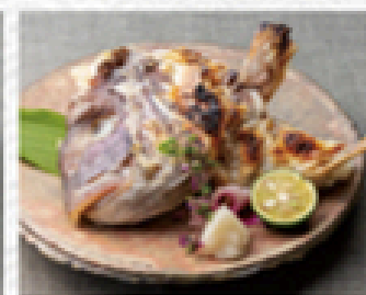
鯛かぶと塩焼き 880円(税込950円)