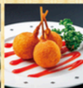
ミニチーズドッグ 400円 (税込440円)