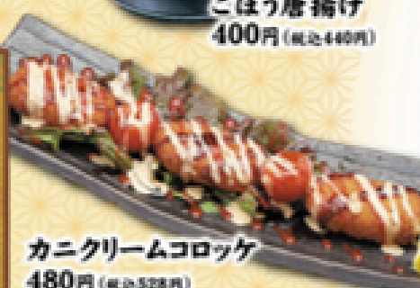
カニクリームコロッケ 480円 (税込528円)