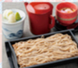
そば(ハーフ)茶碗蒸しセット 600円(税込660円)