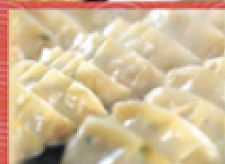
焼き餃子 400円 (税込440円)