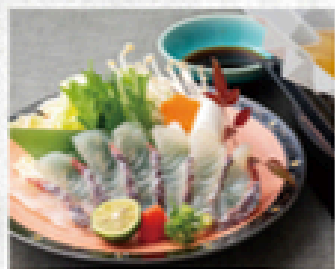
鯛のしゃぶしゃぶ 1,200円(税込1,320円)