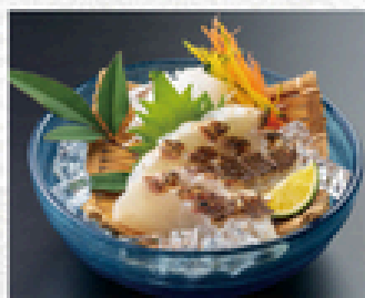
鯛の炙り造り 800円(税込880円)