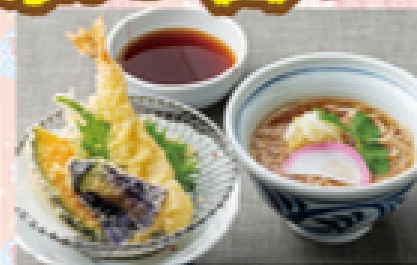
そば(ハーフ)天ぷらセット 800円(税込880円)