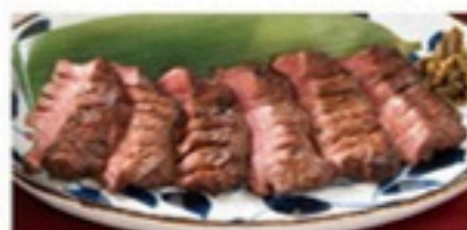
熟成牛タン(味噌味)

1,430円(税込1,573円) [ハーフ] 720円(税込792円) 282kcal 145kcal