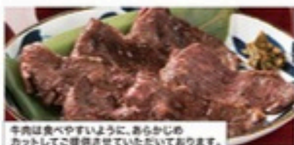
牛ハラミたれ焼き

1,480円(税込1,628円) [ハーフ] 740円(税込812円) 315kcal 161kcal