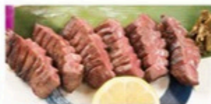
熟成特上芯タン(塩味)

1,880円(税込2,068円) [ハーフ] 940円(税込1,030円) 363kcal 185kcal