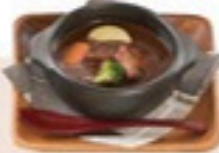
タンシチュー(単品)