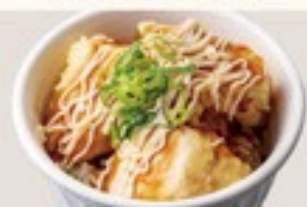
ミニとり天 マヨ南蛮丼