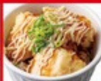
ミニとり天 マヨ南蛮丼